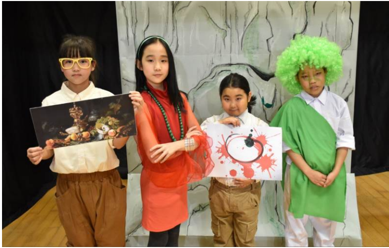
右圖：商人生菜老板(4D 梁纓飾) 隨從荳芽(2D 張渝粵飾) 畫家土豆(4C 盧楚楚飾) 富家女西紅柿小姐 (5B 周靜希飾)