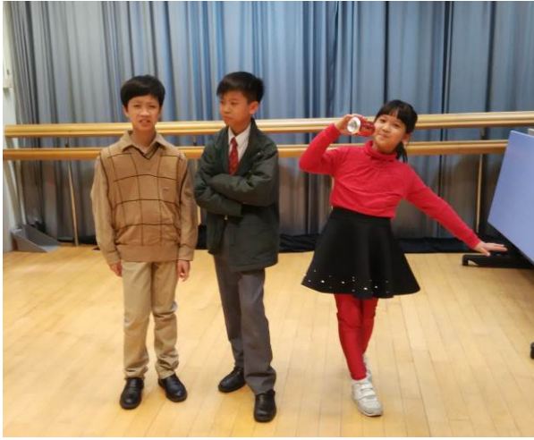
左圖：汽水罐(3C 盧楚楚 飾)、 大雄(6A 邱君 飾)、廢紙 (6A 余澤軒 飾)共聚一堂。